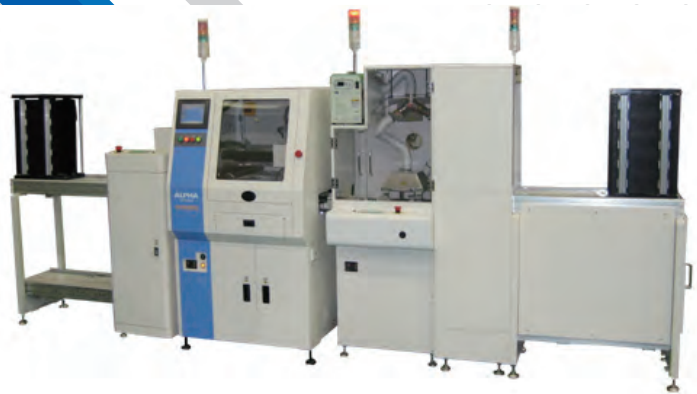
line system 构成例